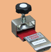
【事務局貸出し用アシストペダルASP-II】