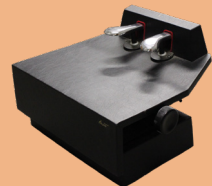
【事務局貸出し用補助ペダル】 M-60（ムツミ木工製作所）。 高さは13cm～26cmまで調整可能。